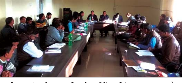
‘बेटी बचाओ बेटी पढ़ाओ’ कार्यक्रम के अंतर्गत आरंभ किए गए। नवाचार सेल्फी विद सुकन्या अभियान चालू किया गया था। जिसमें कोई भी व्यक्ति अपनी बेटी के साथ