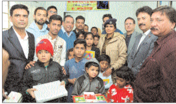
विजेता बच्चों के साथ पुलिस उपायुक्त व अन्य अतिथि।