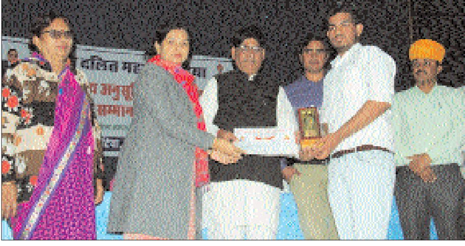
प्रतिभाओं का सम्मान करते अतिथि।

भंडारन, विक्रय परिवहन तथा उपयोग जिला पुलिस अधीक्षक (ग्रामीण) जोधपुर के क्षेत्राधिकार में निषेध किया गया है। कोई भी व्यक्ति यदि धातु के मांझे या इस प्रकार के मांझों का भंडारन, विक्रय, परिवहन तथा उपयोग करेगा तो उसके यथा प्रचलित सम्यक कानून के तहत कार्यवाही की जाएगी। आदेशानुसार आमजन को यह भी निषेध किया गया है कि पक्षियों को नुकसान से बचाने के लिए प्रातः 6 से 8 बजे तथा शाम 5 से 7 बजे तक पतंग उड़ाने पर प्रतिबंध रहेगा।