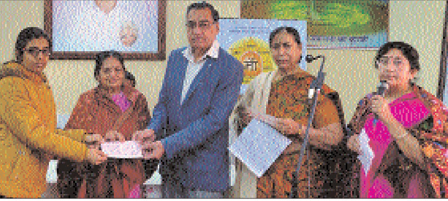
छात्रवृत्ति चैक का वितरण करते अतिथि।