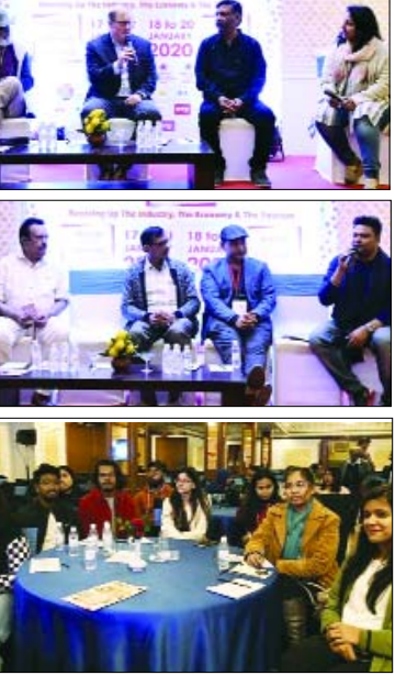
जयपुर इंटरनेशनल फिल्म फेस्टिवल-जिफ 2020 के तीसरे दिन जहां सिलेंसिलेवार फिल्मों का मेला सजा, वहीं फिल्मों पर से जुड़े अहम मुद्दों पर भी दिग्गजों ने अपनी बात रखी।

जयपुर इंटरनेशनल फिल्म फेस्टिवल-जिफ 2020 के तीसरे दिन जहां सिलेंसिलेवार फिल्मों का मेला सजा, वहीं फिल्मों पर से जुड़े अहम मुद्दों पर भी दिग्गजों ने अपनी बात रखी। इंटरनेशनल को प्रोडक्शन मीट हुई, जहां फिल्म निर्माताओं ने आपसी संवाद किया। गौरतलब है कि जयपुर इंटरनेशनल फिल्म फेस्टिवल-जिफ 2020 पर्यटन विभाग, राजस्थान सरकार के सहयोग से 21 जनवरी तक आयनर्स सल्लों सिमना हॉल, जी.टी. सेन्ट्रल और होटल क्लक्स आमेर में आयोजित हो रहा है।