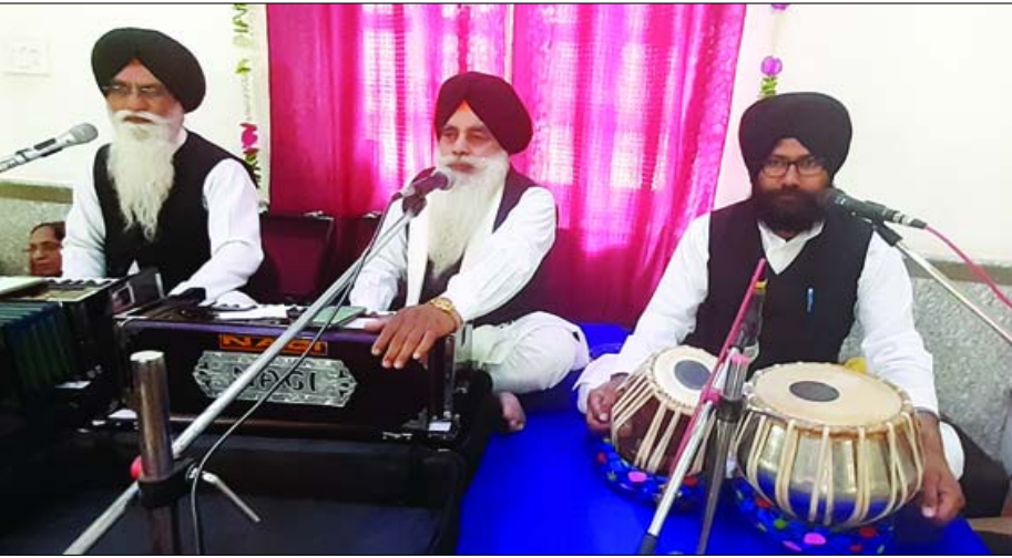
कीर्तन पेश करते रागी।