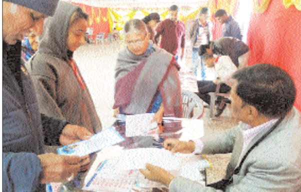
मरीजों की जांच करते चिकित्सक।