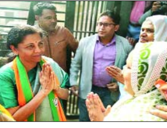
सीए से इरने की ज़रूरत नहीं है। सीए से अल्पसंख्यकों को नगरिकता मिलेगी। उन्होंने खत के बरसों में पड़ोसी देशों से आए मुस्लिम परिवारों को दो गैर-नागरिकता के आंकड़े भी गिनाए।

नागरिकता संशोधन कानून (सीए) को लेकर जारी विवाद के बीच भाजपा ने जनसमर्थन जुटाने के लिए घर-घर दस्तक देने शुरू कर दी है। राजधानी जयपुर में केन्द्रीय वित्त मंत्री निर्मला सीतारमण के नेतृत्व में भाजपा कार्यकर्ताओं ने रविवार को मुस्लिम बहुल इलाकों से लेकर दलित बस्तियों के बीच जनजागरण अभियान का आगाज किया। भाजपा का यह जनजागरण अभियान जयपुर में खासा सुरिखियों में रहा।