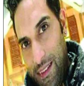
समुदाय में आक्रोश बढ़ने के आसार

पाकिस्तान में ननकाना साहिब गुरुद्वारे पर हुए पथराव के बाद एक बार फिर अल्पसंख्यकों को निशाना बनाया गया है। पेशावर में एक सिख युवक की अज्ञात व्यक्ति ने हत्या कर दी गई। पुलिस ने बताया कि मृतक का शव चांभकानी थाना क्षेत्र में मिला। मृतक की पहचान नहीं हो सकी है। इससे पाकिस्तान में रह रहे सिख समुदाय में आक्रोश बढ़ने के आसार