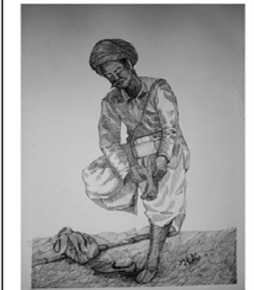
'मरुभरा की बोलती जीवनचर्चा'। कला और दृष्टिकोण का अनूठा संगम है यह चित्र। चौहटन के अद्वितीय चित्ररे खेता जांगिड़ की बनाई यह कलाकृति मरुस्थलीय जीवन की बारीकी का वर्णन करती है।