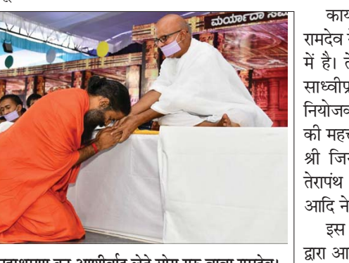
आचार्य महाश्रमण का आशीर्वाद लेते योग गुरु बाबा रामदेव।

हो तो व्यक्ति दूसरों का उत्थान करें, सेवा करें। अपना योगदान दें। सेवा से जीवन सार्थक बनता है। हम तेरापंथ में साधना कर रहे हैं। शरीर के साथ चित्त समाधि का भी महत्व है। सेवा करने के साथ-साथ हम सामने वाले के मन को,