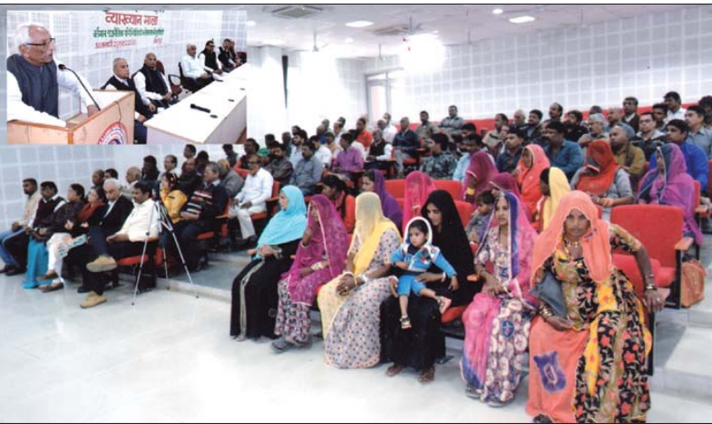
उपस्थित जन और इंसैट में उद्बोधन देते वक्ता व मंचासीन अतिथि।