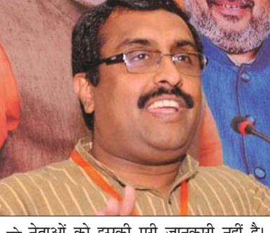
रहे नेताओं को इसकी पूरी जानकारी नहीं है। इसके अलावा वह नई चीजों को ग्रहण नहीं करना चाहते। हमारे स्कूल के दिनों में वाटरपुफ घड़ी पहनने का चलन था। जिसमें पानी नहीं जा सकता था। ठीक उसी तरह विपक्षी नेता सीएए को लेकर पूर्वधारणा से प्रसिद्ध हैं।

देशभर में नागरिकता संशोधन कानून (सीएए) का विरोध हो रहा है। इसी बीच भाजपा महासचिव राम माधव ने कहा कि सीएए के खिलाफ देशभर में हुई हिंसा में निर्दोष लोग भी मारे गए। उन्होंने कहा, विपक्ष के नेतृत्व में देशभर में कई स्थानों पर हिंसक प्रदर्शन हुए। जिसमें कई बेगुनाहों की जान चली गई। भाजपा मुस्लिमों को नागरिकता देने के खिलाफ नहीं है। यदि ऐसा होता तो पाकिस्तान से आए गायक अदनाम सामी को भारतीय नागरिकता नहीं दी जाती। माधव ने कहा, यह कानून किसी को व्यक्ति को देश से बाहर नहीं करता है बल्कि उन लोगों को नागरिकता प्रदान करता है जो पाकिस्तान, अफगानिस्तान और बांग्लादेश में धार्मिक आधार पर उरीयूड झेलते रहे हैं। सीएए का विरोध कर