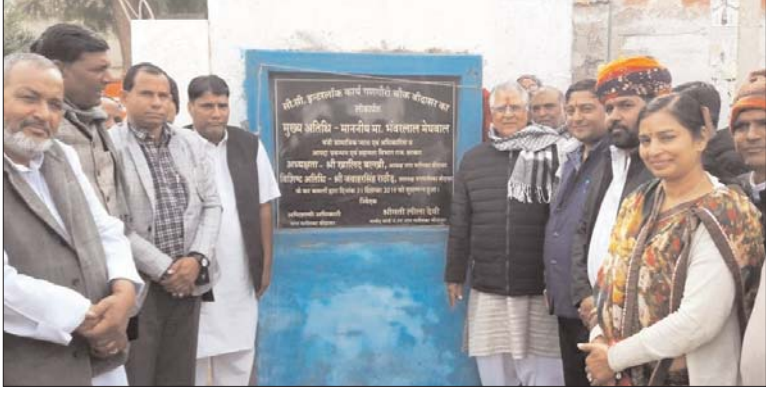
सामाजिक न्याय एवं अधिकारिता मंत्री ने इस दौरान बीदासर में बंद पड़े अस्पताल को दुबारा शुरू करने की बात भी कही। इस मौके पर उन्होंने अधिकारियों से कहा कि वे योजनाओं का लाभ अधिकारियों के व्यक्ति तक पहुंचाए तथा पिछड़ी

इस दौरान आयोजित समारोह को संबोधित करते हुए सामाजिक न्याय एवं अधिकारिता मंत्री ने बीदासर नगर पालिका को एक करोड़ रुपए विकास के लिए देने की बात कही तथा बीदासर अस्पताल में रिक्त पड़े चिकित्सकों के पदों को भरने का आश्वासन दिया। उन्होंने बीदासर के गणगौरी चौक में मंच बनाने की घोषणा की तथा धापूदेवी बालिका उमावि से बस स्टैंड तक गौरव पथ का पुनः निर्माण कराने का आश्वासन दिया।