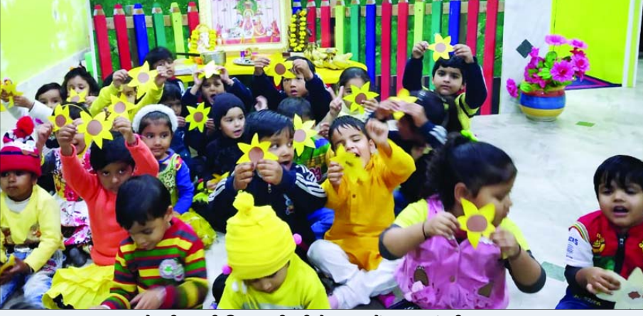
जयपुर के सीतावाड़ी स्थित हनीबीनी पी स्कूल में वसन्त पंचमी उत्सव मनाया गया, इस अवसर पर बच्चों ने फूलों जैसी मुस्कटारह बिखेरी