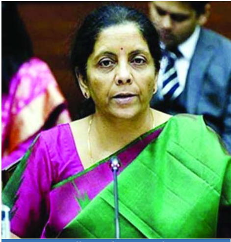
सर्वेक्षण की मुख्य बातें

वित्त मंत्री निर्मला सीतारमण शनिवार को 11 बजे अपना दूसरा बजट पेश करेंगी। मोदी सरकार के इस दूसरे बजट पर देश और दुनिया की निगाहें लगी हुई हैं, क्योंकि चालू वित्त वर्ष में भारत की आर्थिक वृद्धि की रफ्तार के एक दशक के न्यूनतम स्तर पर रहने का अनुमान प्रकट किया गया है। दूसरी ओर टेक्स कलेक्शन में भी उल्लेखनीय कमी आई है और राजकोषीय घाटे के भी सरकार के बजट लक्ष्य से अधिक रहने का अनुमान है। सीतारमण के समक्ष इस बजट में संतुलन कायम करने की सबसे बड़ी चुनौती है। सितंबर, 2019 में कांफ़ेंस टेक्स में भारी कमी के बाद देश का मिडिल क्लास इनकम टैक्स के मोर्चे पर रिलीफ की उम्मीद कर रहा है।